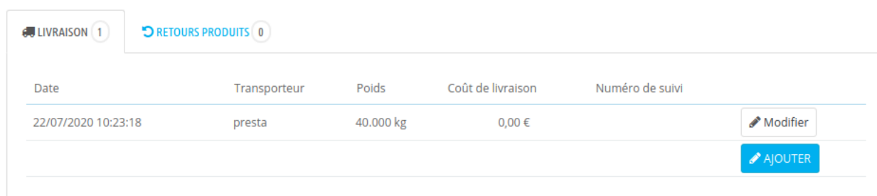
FIGURE 5 – Détails de commande

Depuis la page d'affichage des détails d'une commande, rendez-vous dans la section "Livraison". Vous devriez avoir un affichage équivalent à celui-ci :