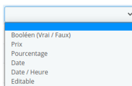
FIGURE 2 – Types de colonne

Comme vous pouvez l'apercevoir, vous pouvez donner des types à vos colonnes. Ces types permettent d'avoir un affichage personnalisé selon les colonnes. Par exemple, une colonne de type "Prix" aura ces valeurs formatées en prix avec le nombre de chiffres derrière la virgule et la devise selon la configuration de votre boutique.