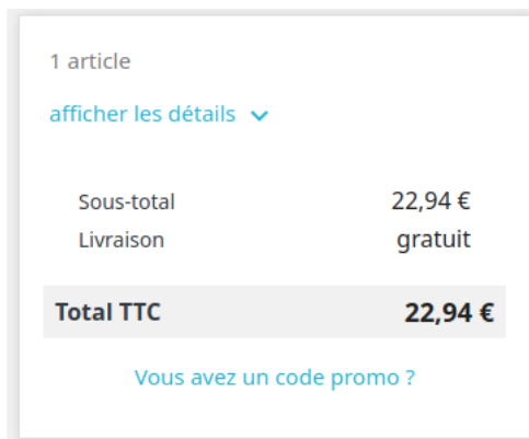
FIGURE 7 – Récapitulatif de commande